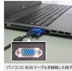
パソコンに RGB ケーブルを接続した様子

ケーブルが差さったままだと、パソコン本体やイヤホンから音声出力されない場合がありますので、充電コード、イヤホン以外のケーブル類は抜いてください。