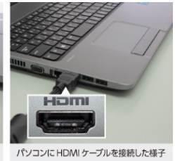
パソコンに HDMI ケーブルを接続した様子